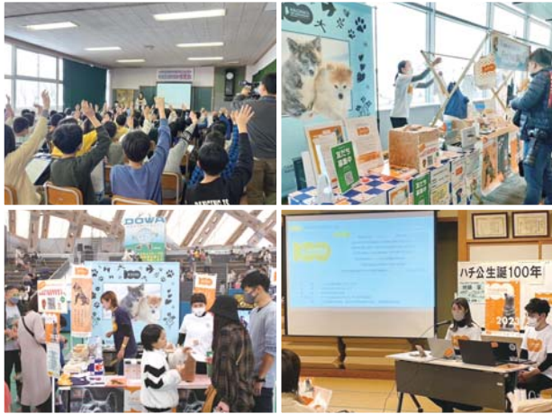
市内外での HACHI100 周知活動